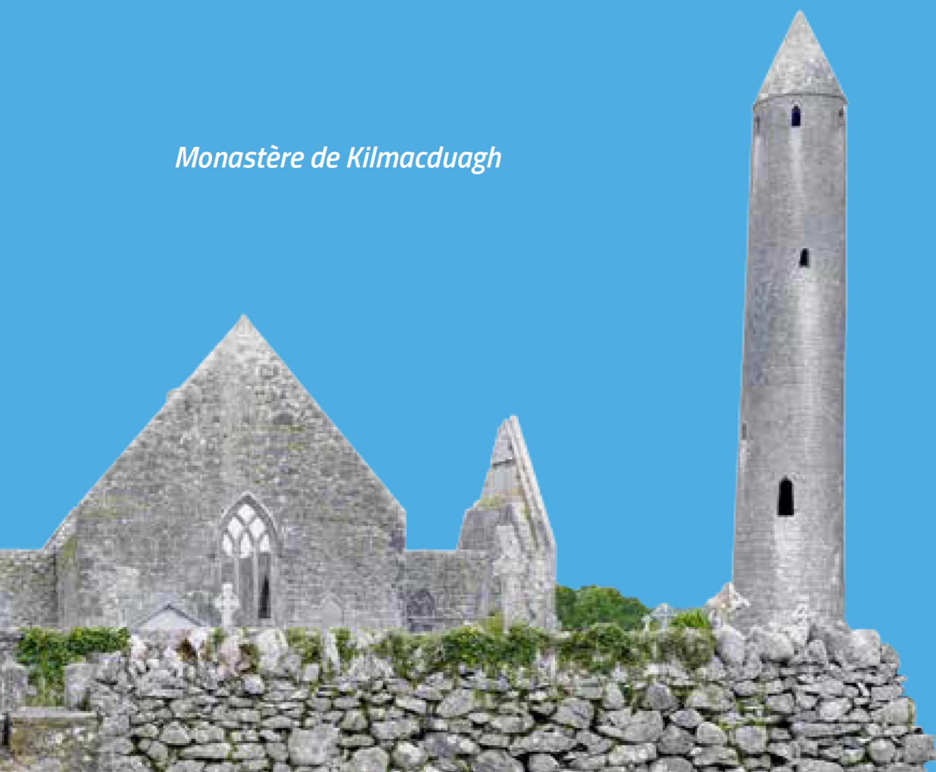
Monastère de Kilmacduagh

Né à Dublin en 1882, le grand écrivain irlandais James Joyce est aujourd'hui commémoré partout en Irlande. Il publia son premier livre Dubliners (Les Gens de Dublin) en 1914. La parution en 1922 de Ulysse , considérée comme une œuvre particulièrement innovante, forgea sa réputation.