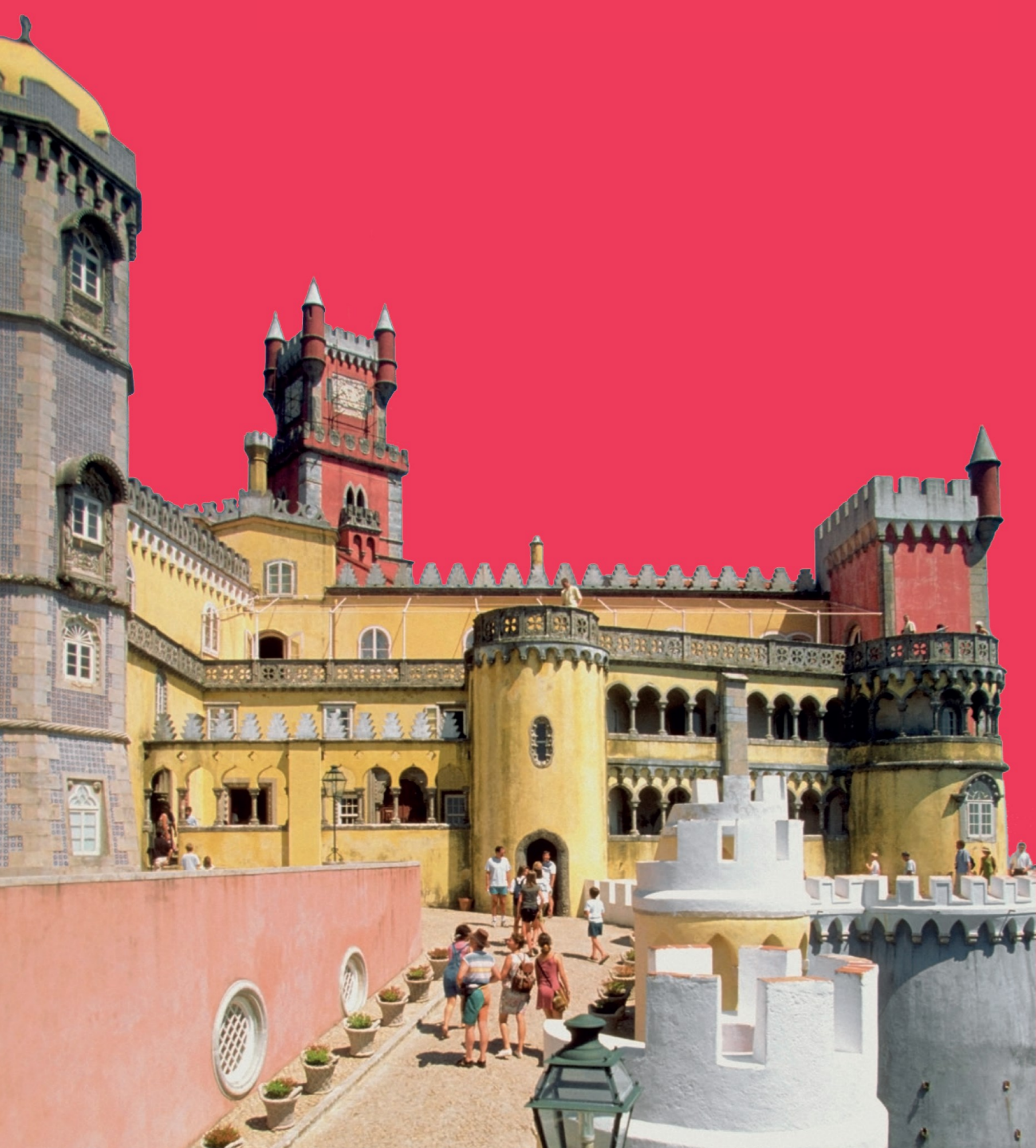
Palais national de Pena

Construite entre 1515 et 1521, la tour de Belém est un véritable joyau architectural. Cet édifice, construit à l'entrée du port de Lisbonne, était à l'origine situé au milieu du fleuve, le Tage, afin de défendre l'entrée de la ville d'éventuelles attaques ennemies.