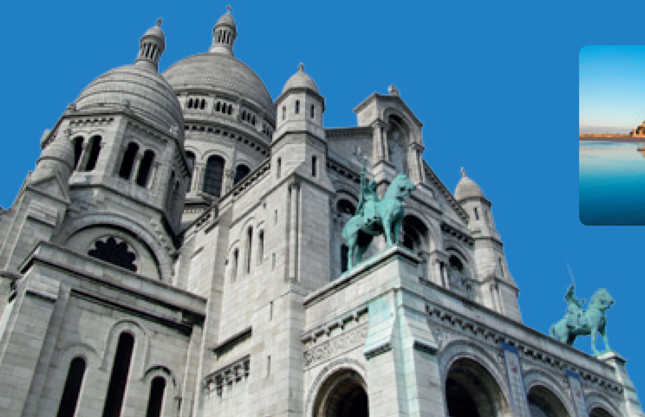
La Basilique du Sacré-Cœur de Montmartre

Première destination touristique mondiale, la France attire chaque année des millions de visiteurs. Ses atouts sont multiples : paysages variés, riche patrimoine architectural et historique, diversité gastronomique, musées et parcs d'attraction.